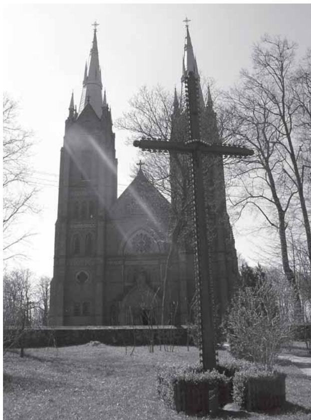
Salontū Švč. Mergelės Marijės Jiemėma i dongu bažninčė. Ramuonātės Danutės portėgrapėjė