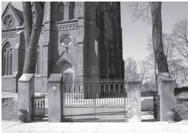
Salontū Švč. Mergelēs Marijēs Jiemēma i dongu bažninčēs pastata fragmēnts.

Gorskiu šeimīnuo Liodvēka bova tretiesis vāks. Jau auga bruolis Stanisluovs, sesou Teoduora. Tievs dēdēlē tēkiejuos dar vēina sūnelē. Nuors trējum sūnūm rēkijē, kad Gorskiu gēmēnie skleistomēs, naēšniktom. Ēr še tau – atkeliava ont šiuo svieta dar vēina pana, nalaukta, ēr, rasiet, nadēdēlē milēma. Žēnuomās, mergelē natsēmēnē, kāp prabiega anuos kūdēkistē, bet ana isēgalvuojē, kad par vēsa sava gīvenēma meilēs patirē par mažā. Puo posontrū metu atsērada bruolis Levuons. Ton vēsē miliejē ba gala – ēr tievs, ēr