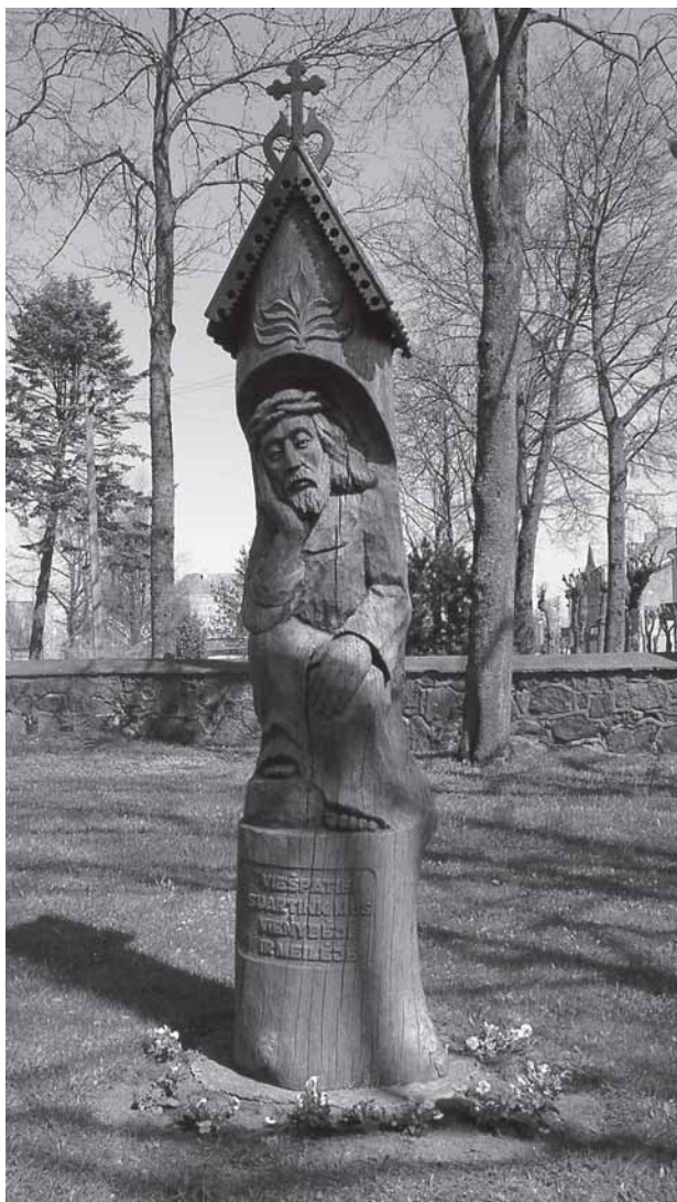
Skulptūra „Rūpintuojielis“ Salontū Švč. Mergelės Marijės Jiemėma i dongu bažninčės šventuoriou. Ramuonātės Danutės portėgrapėjė

Tēp prabiega dvė liūdnas vasaras. Trečiuojė nosėdavė linksmesnė. Matā, mažė Uonā sojė dvilėka metu, tad buobotė pakielė prašmatni balio. Duovėnum Anskā nopėrka stuora maldakningė „Zlofi Altarž“. Soėiškuojė kapelėjė so skripičė, cimbuolās ēr trūbo, tad, kas muokiejė šuoktė, galiejė vēsėms pasėruodītė. Liodvėka ēr anuos seseris tuo bova pamuokītas: puora metu gīvena Salontūsė gover-