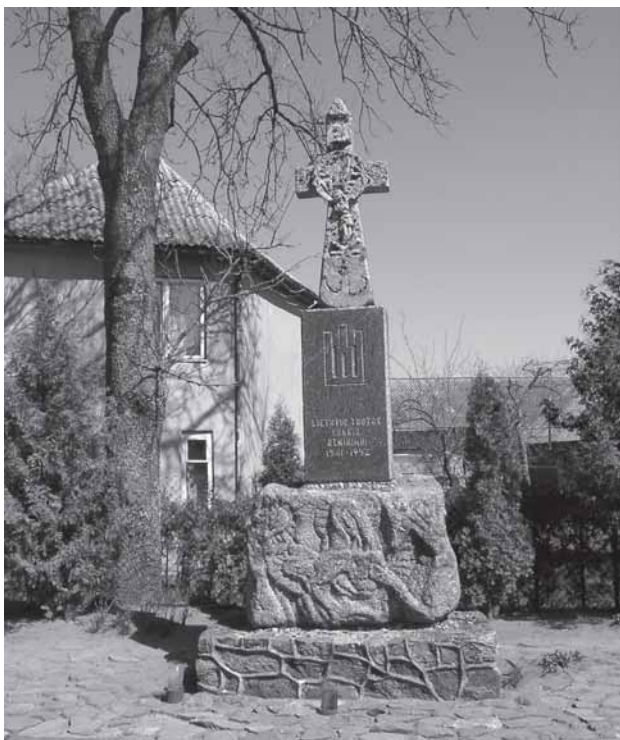
Paminklos, skėrts lietuviu tautuos kančiuoms 1941–1952 m., Salontū Švč. Mergelės Marijės Jiemėma i dongu bažničės švėntuoriu.