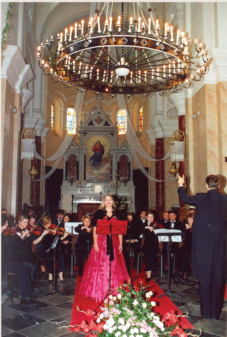
Apačioje – Rietavo bažnyčios pastato fragmentas.

Rugsėjo 29–30 d. Plungės šv. Jono Krikštytojo bažnyčioje ir Žemaičių dailės muziejuje vyko mokslinė konferencija „Krikščio-