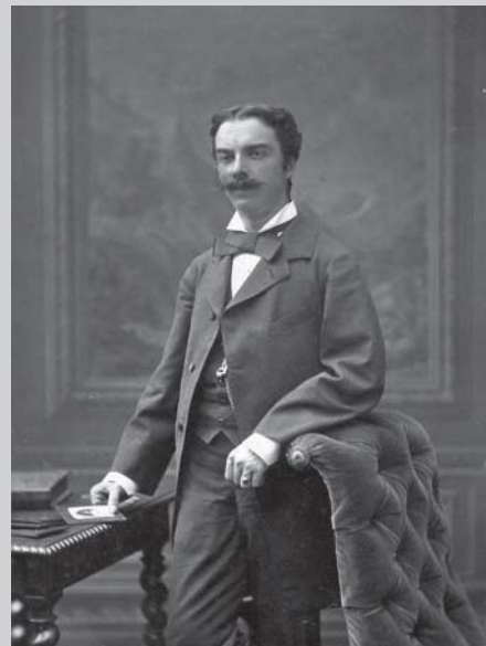
Nuotraukoje – Plungės kunigaikštis Mykolas Oginskis (1849–1902).

Straipsnis parengtas pagal autorės pranešimą, perskaitytą 2004 m. Žemaičių dailės muziejuje (Plungė) įvykusioje mokslinėje konferencijoje „Kunigaikštis Mykolas Oginskis. Veikla ir istorinis palikimas“