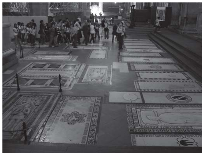
Florencijos Santa Croce šventovės grindyse suklotos balto marmuro antkapinės plokštės ženklina daugelio iškiliių pasaulio kultūros, meno, mokslo veikėjų amžinojo poilsio vietą

Kai bazilikos tarnautojų mandagiai paraginti su paskutiniais lankytojais išėjome į saulėlydžio gaisais nušviestą erdvią bazilikos aikštę, dar ilgai negalėjome nuo jos atitraukti akių. Pietrytiniame kampe parimęs dūlavo didingas Dantės Aligieri monumentas. Tauria marmuro spalva švytėjo trikampiai šventovės frontonai (jų forma ir proporcijos priminė Rietavo šv. arkangelo Mykolo bažnyčios centrinį altorių).