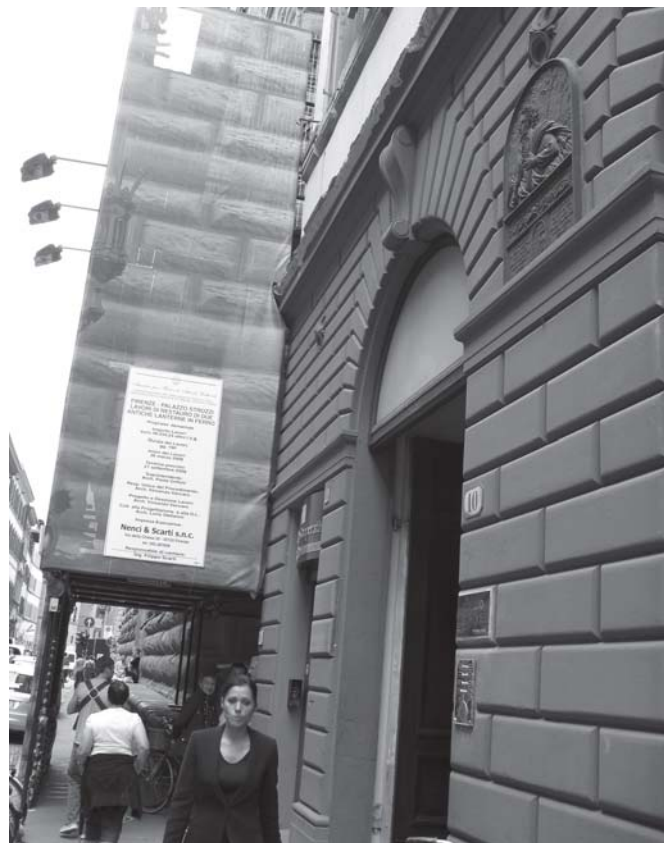
Florencija. Apačioje – Tornabuoni gatvė (dešinėje – namas, kuriame gyveno Mykolas Kleopas Oginskis); viršuje – vaizdas nuo namo Tornabuoni gatvėje, kuriame gyveno M. K. Oginskis į Arno upės pusę