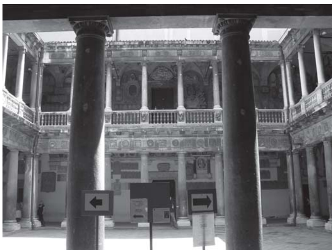
Paduvos universiteto (Italija) rūmų fragmentai