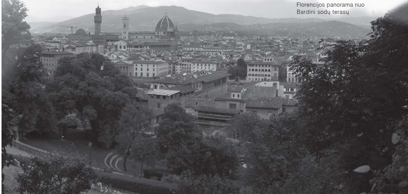
Florencijos panorama nuo Bardini sodų terasų