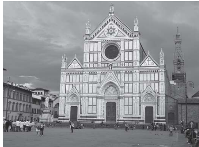
Iš kairės: Florencija. Santa Maria Novella; Santa Crose bazilika. Čia, Švč. Sakramento koplyčioje, dabar ilsisi Mykolo Kleopo palaikai

jančios podagros, stengėsi gyventi pilnakraujį kultūrinį gyvenimą. Šiuose rūmuose 1829 m. vasarą svečiavosi Adomas Mickevičius, jo bendražygis Antonis Odyniecas. Kompozitorius ir poetas žaidė šachmatais. Vėliau A. Odyniecas rašė: „...Aš valandų valandas būčiau klausęs įdomių ir turiningų Oginskio pasakojimų. Bet kada gi? Tuo metu, kai užsibūdavome kiek ilgiau, ant stalo atsirasdavo ta prakeikta šachmatų lenta ir, jam su Adomu sėdus žaisti partijos, pokalbis apsiribodavo dviem žodžiais „šachas“ ir „matas“.