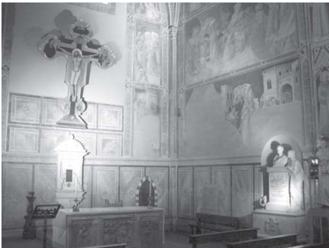
Mykolo Kleopo Oginskio amžinojo poilsio vieta Santa Croce (Švento Kryžiaus) bazilikoje (Florencija, Italija). Čia, Švč. Sakramento koplyčioje, kuri vadinama ir Castelliani vardu, greta altoriaus, XIV a. dail. Agnolo Gaddi freskų fone, boluoja marmurinis M. K. Oginskio biustas (skulpt. Francesco Pozzi)

Aikštėje būriavosi retėjančios turistų grupelės. Viename kitame krašte skambėjo gyva muzika. Atrodo, kad ranka pati savaime išsitraukė mobilų telefoną ir surinko tekstą bičiuliams į Lietuvą: „Teat-skrieja per lygumas ir Alpes sveikinimo žodis iš Florencijos. Visų bendraminčių vardu Santa Croce šventovėje nusilenkėme M. K. Oginskio atminimui. Svajonė: visiems susirinkus į šią nuostabią aikštę jubiliejiniais M. K. Oginskio metais išgirsti, kaip orkestras griežia polonezą „Atsisveikinimas su Tėvyne“.