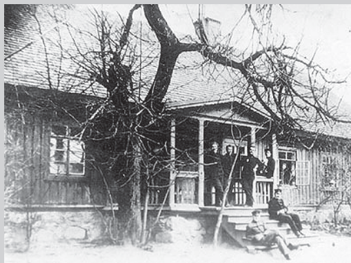
Plungės dvaro muzikos mokyklos pastatas. XX a. pr.

Parengta pagal informaciją, skelbiamą interneto leidinyje „Nacionalinis M. K. Čiurlionio dailės muziejus“ (internetu prieiga http://www.ciurlionis.lt/index.php?f=cfc7141a7f&lg=lt , žr. 2008 06 15)