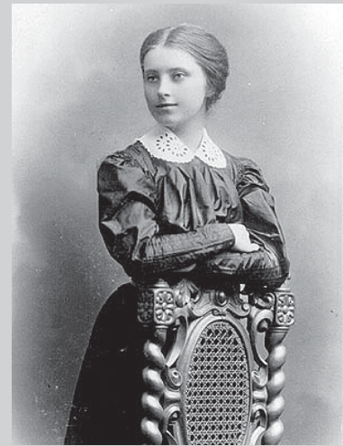
Iš kairės: Nuotraukoje – M. K. Čiurlionis 1898 m. Varšuvoje. ŽDM, P. m. – 177; Konstantinas ir Sofija Plungėje 1909 m.; Sofija Kymantaitė, 1907 m. ŽDM, P. m. 797/10