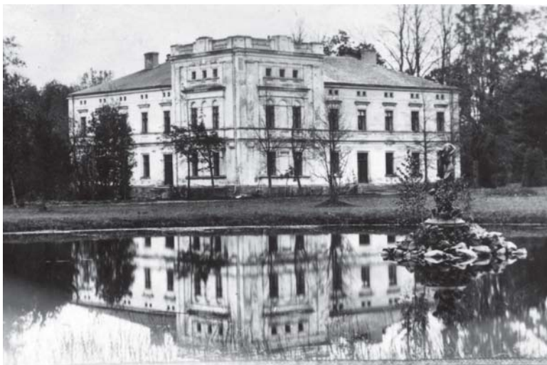
Plungės dvaro oficina – buvusi dvaro raštinė. Apie 1911 m. Manoma, kad šiame pastate yra veikusi ir Plungės M. Oginskio dvaro muzikos mokykla.