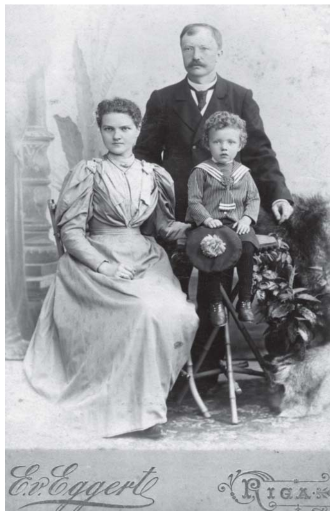
Rygos fotografo E. Egerto fotoateljė daryta Plungės dvariškių nuotrauka

Rinkinyje nuotraukų tematika labai įvairi. Pirmiausia, tai fotodokumentai, pasakojantys apie Plungės bei jos apylinkių, Rietavo miesto istoriją, siužetinės fotografijos (geležinkelio tiesimas, malūnai, piliakalniai, Kauno, Palangos, Kretingos miestų vaizdai ir t. t.)