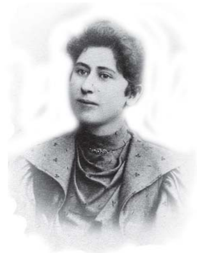
Plungės dvaro siuvinėtoja. 1909 m.