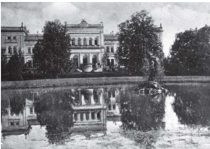
Iš kairės: centriniai dvaro rūmai ir tvenkinys (didžiajame parko parteryje). Apie 1911 m. GEK –4960/10; Talka prie Plungės dvaro laikrodinės pastato. Apie 1935 m. GEK-4960/4