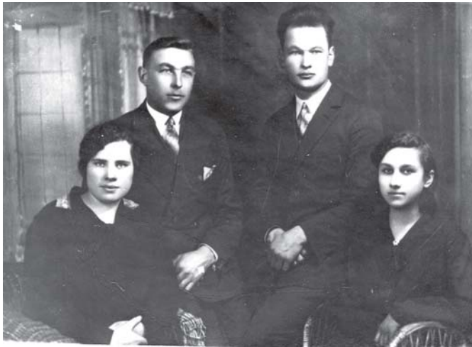
Kretingos vartotojų bendrovės parduotuvės geležies skyriaus tarnautojai