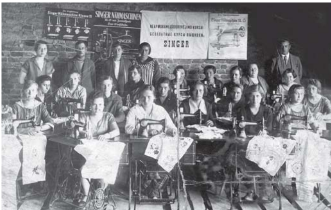
1925 m. Salantuose (Kretingos r.) vykusių siuvėjų kursų absolventai