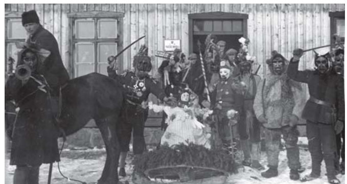
1933 m. Užgavėnių karnavalo dalyviai prie Kurmaičių (Kretingos r.) pradinės mokyklos