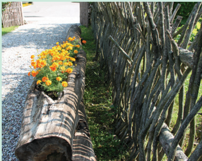
Žemaičių gėlynai.