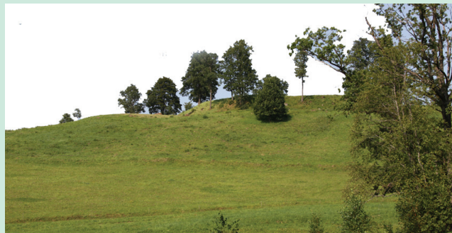
Bilionių piliakalnio fragmentas.

Įvado vietoje. Ateities veiksmus planuojame pagal turimą patirtį. Jei jos neturime, turime vadovautis kitų patarimais, nurodymais ir įsakymais. Jei nežinome tikrosios Lietuvos praeities, tenka vadovautis ta Lietuvos istorija, kuri buvo parašyta (suklastota), siekiant mumis manipuliuoti – tampame minia, aklais piktais šuniukais, kuriuos politikai ir jiems dirbantys istorikai gali kada panorėję siundyti ant savo asmeninių priešų. Ir kas žino? – Kada nors už nemokšišumą gali tekti labai brangiai sumokėti.