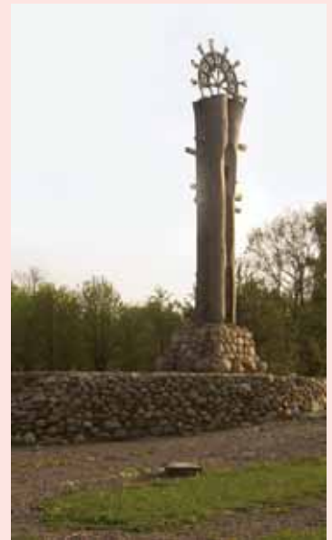
Nuotraukose – 2002 m. Kretingos parke įrengto Saulės laikrodžio ansamblio fragmentai.