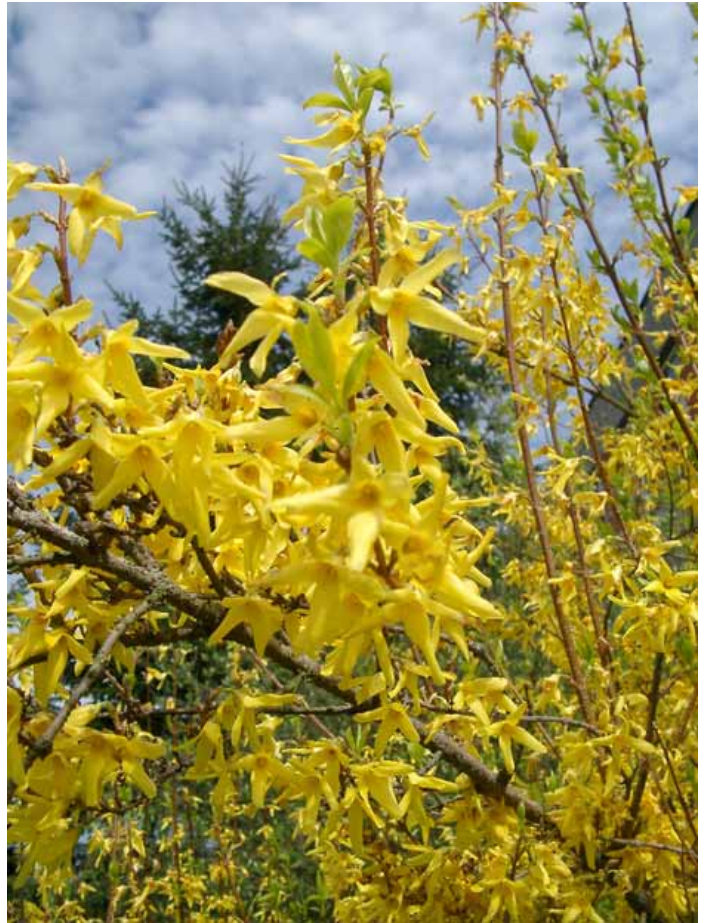
Pavasario žydėjimas...