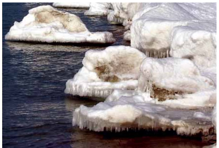
Užšalusi Baltijos jūros pakrantė.