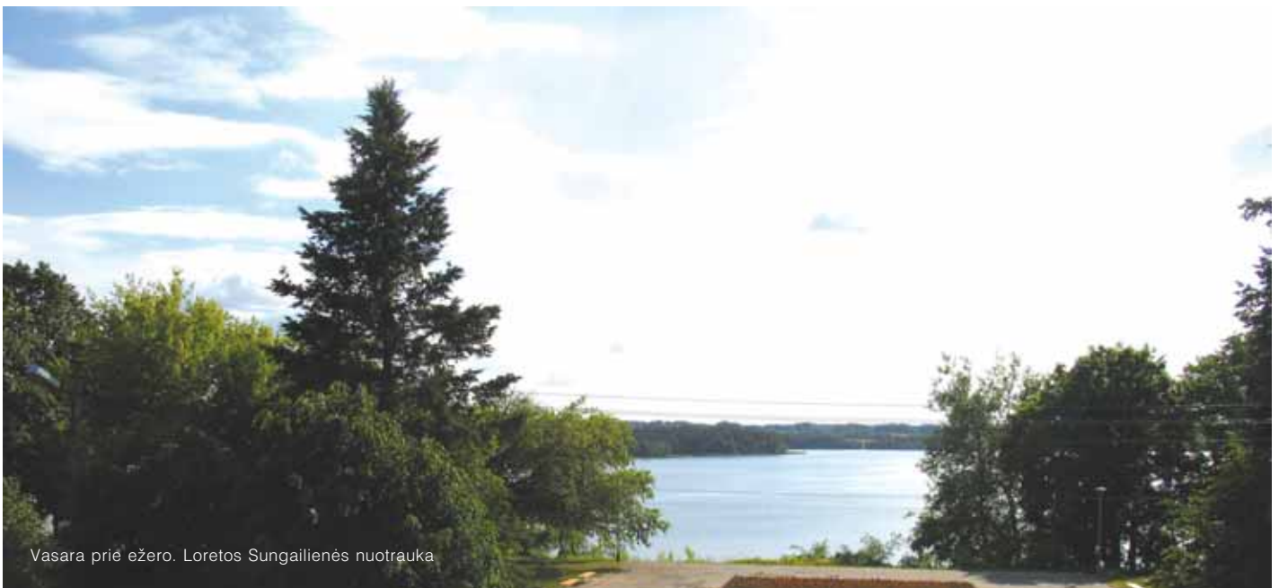
Vasara prie ežero.