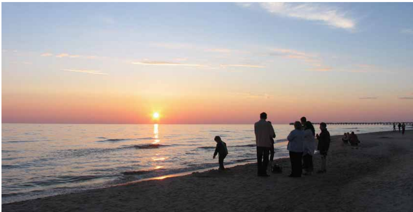
Saulėlydis vasarą Palangoje