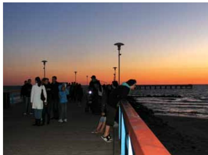
Vėsus vasaros vakaras prie Baltijos jūros; saulės palydos Palangoje.