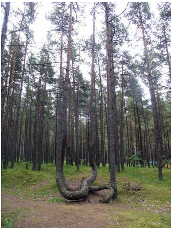
Natūralė išaugės Palonguos pušina pošėis kamiens-soulielis