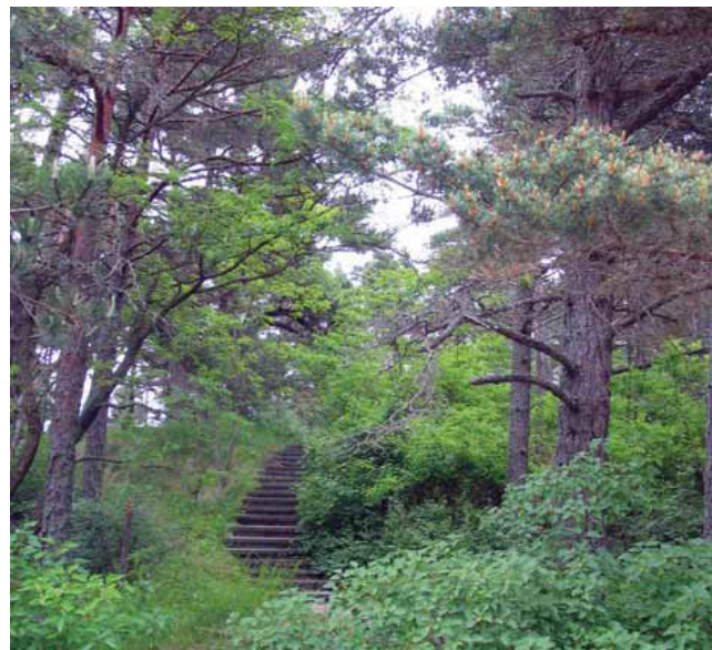
Laiptā i Palonguos Naglė kalna