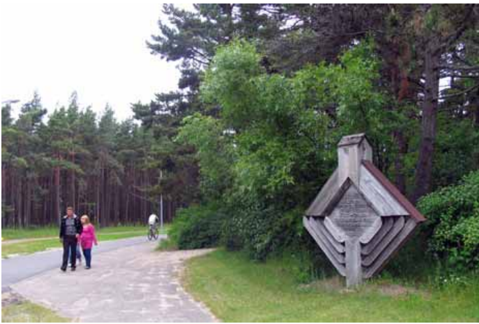
Palonguos Naglė kalna inpormacėnė lėnta

soaug mana lūžės stėbėkaulis, kap ka jodvė dvė ka esatau soaugosės“; „Sotaikīk muni so vīro, kap tiktā soaugosės pušis ka gīven“; „Prirėšk pri monės mona mīlėmouji, kap ja jodvė esatau vėina pri kėtuos prisėrėšosės“.