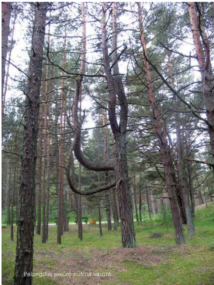
Palonguos pajūrė pušina vaizdā