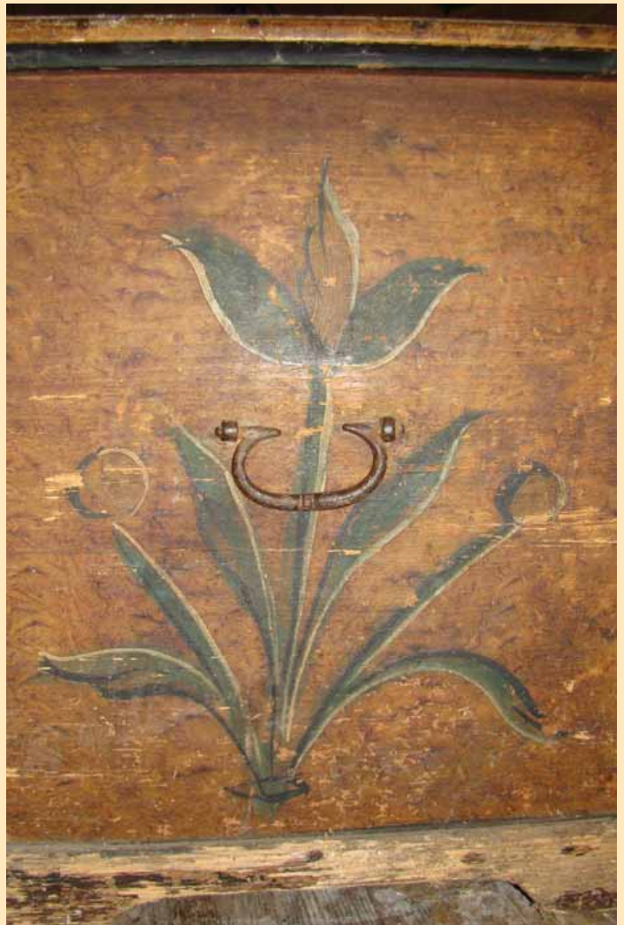
Platelių krašto baldų puošybos pavyzdžiai.