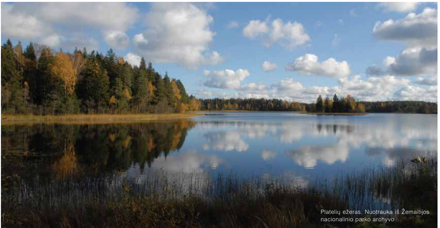
Platelių ežeras.