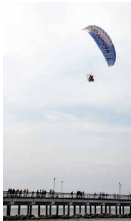
(Atkelta iš 21 p.)

metās soplaukė vėsė geriausė krašta tautodailininkā, kulinarėnė pavelda specelistā.