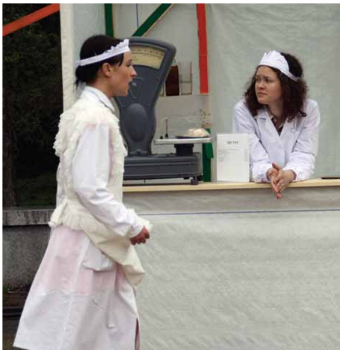
(Atkelta iš 23 p.)

jė i dar daugiau išsėmarkavusi „Palonguos Jozės“ kermuošio. Kavėnie „De Cuba“ (J. Basanavičė g. 28) lonkītuojų laukė tretiuoji tarptautėnė dekoratīviniu balondu paruoda.