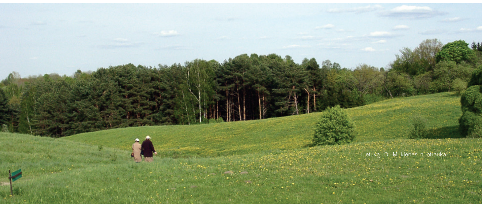
Lietuva, D. Mukienės nuotrauka