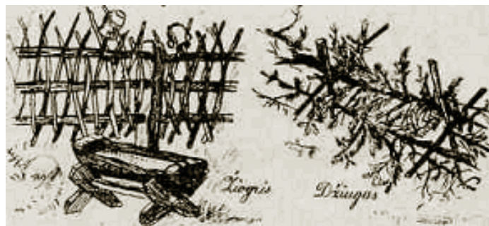
Žiogriai. Ilustracija iš leidinio „Gimtasai kraštas“ (Šiauliai, 1936 m. sausis–kovas, Nr. 1 (9), p. 19–23

vulių: kiaulių, avių ir ožkų, taip pat ir nuo paukščių. Višta per žiogrį nepralįs ir bijos per žiogrį lėkti arba ant jo nutūpti.