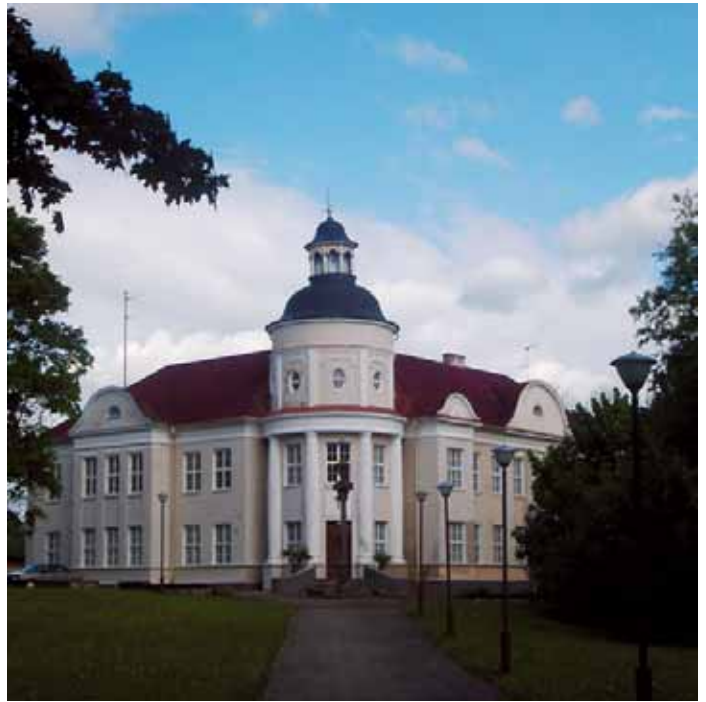
Telšių vyskupijos kurija.