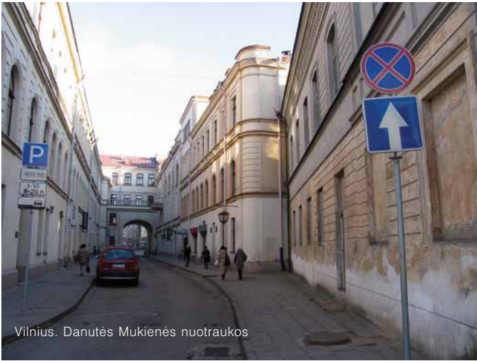
Vilnius.