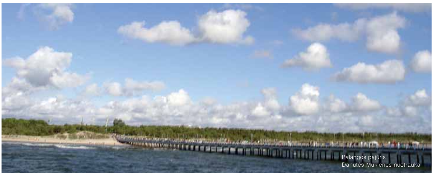
Palangos pajūris