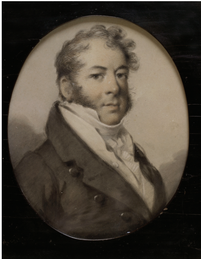
Mykolo Kleopo Oginskio (1765–1833) portretas. Dailininkas Aleksandras Liudvikas Molinari (Aleksander Ludwik Molinari, 1805–1868). Popierius, pastelė, akvarelė, 20,2 x 16,4. Kūriny saugomas Nacionaliniame M. K. Čiurlionio dailės muziejuje