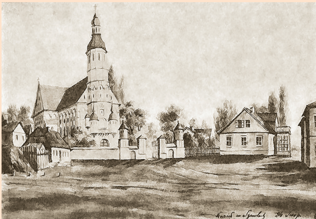
Šiaulių miesta cėntros senuo atvėrelie.

Šiaulių universitetė ĩr atléiktamė muokslėnė tĭrėmā šiuos sritis: humanitarėniu, fiziniu, biomedicinas, technuoluogėjės ėr suocelėniu mukslu.