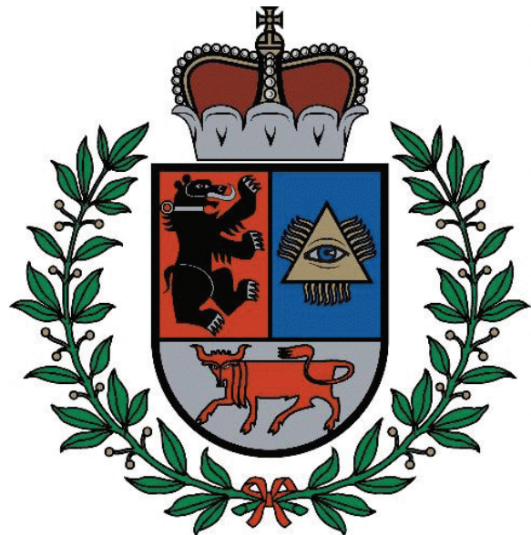
Šiaulių universiteta emblema (ęėnklos)

■ Tarptautėnės studentu ekonomistu ir vadėbėninku asuocėacėjės (AIESEC) Šiaulių skėrios. Adresos: Architektu g. 1, Šiaulė. Tel. (8 41) 512 306.