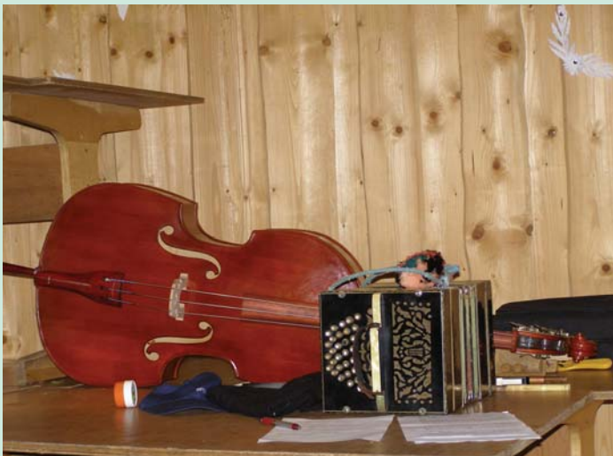
Muzikos instrumentai – basedla ir bandonija

kultūriniu paveldu, norinčias puoselėti dar gyvybingas kultūros tradicijas ir ugdyti intelektualias bei kūrybin-gas asmenybes. Folkloro ansamblio „Virvytė“ nariai – žmonės, kuriems rūpi Lietuvos istorijos, kultūros pa-veldo, gyvosios tradicijos tyrimas, puoselėjimas, raiš-ka. Todėl savo meninę-kūrybinę ir visuomeninę veiklą ansambliečiai nusprendė skirti jaunų, intelektualių šei-mų meniniam, pilietiniam ir tautiniam ugdymui, pasitel-kiant tradicinę kūrybą – jos išsaugojimo, interpretavi-