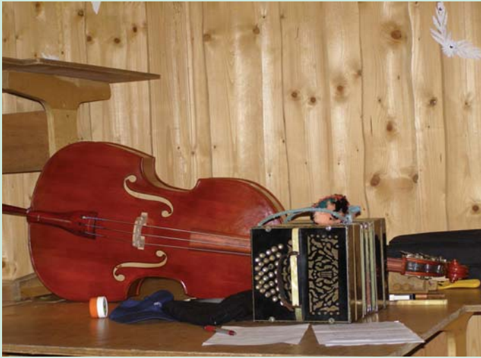
Muzikos instrumentai – basedla ir bandonija

kultūriniu paveldu, norinčias puoselėti dar gyvybingas kultūros tradicijas ir ugdyti intelektualias bei kūrybin-gas asmenybes. Folkloro ansamblio „Virvytė“ nariai – žmonės, kuriems rūpi Lietuvos istorijos, kultūros pa-veldo, gyvosios tradicijos tyrimas, puoselėjimas, raiš-ka. Todėl savo meninę-kūrybinę ir visuomeninę veiklą ansambliečiai nusprendė skirti jaunų, intelektualių šei-mų meniniam, pilietiniam ir tautiniam ugdymui, pasitel-kiant tradicinę kūrybą – jos išsaugojimo, interpretavi-