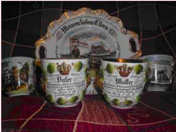
Viršuje – rinkinį sudaro 4 puodeliai ir lėkštė. Kiekvienas puodelis skirtas vienam šeimos nariui: „Mutter“ (mamai), „Vater“ (tėvui), „Bruder“ (broliui) ir „Schwester“ (seseriai). Po kreipinio parašytas palinkėjimas vokiečių kalba. Ant lėkštės didelėmis raidėmis parašyta „Meine lieben Eltern“ („Mano brangiems tėvams“). Dešinėje – ant šios lėkštės taip pat vokiečių kalba parašyti žodžiai