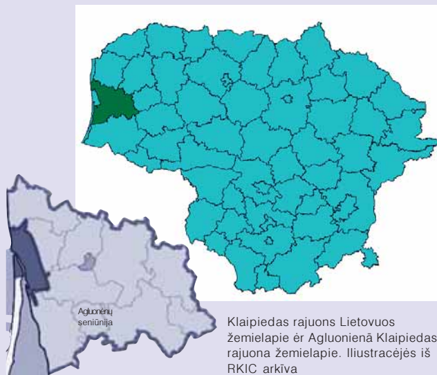
Klaipėdas rajuons Lietovuos žėmielapie ėr Agluonėnā Klaipėdas rajuona žėmielapie. Iliustracėjės iš RKIC arkīva

Rėnginīs ėr prasėdiejė tuos sokaktėis pamėnavuojėmo. Aple pėitus bova pristatīts lietuvninka bŭds ėr papruotė. Suodībuo veikė tradicėniu amatŭ (audėma,