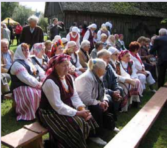
Švėntės dalīvė.

Jaunė ėr senė i tuo rėngini bova sokvėistė 2008 m. rogpjūtė 30 dėina. Kap tik pasitaikė savaitgalis (šeštadėinis), tad žmuoniū i Agluonienu etnuograpėnė suodība sosėrinka daugybė. Vėsa ta švėntė bova skėrta Agluonienu etnuograpėnės suodības ėr kluojėma tėtra ikūrėma 25-uosiems metėniems.