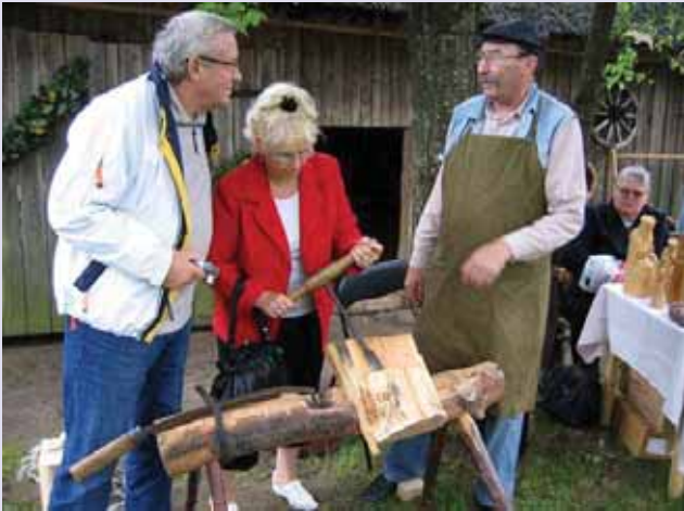
Šventės akimirkos. Krašto žmonės demonstruoja tradicinius amatus ir akimirka iš folkloro kolektyvų koncerto.