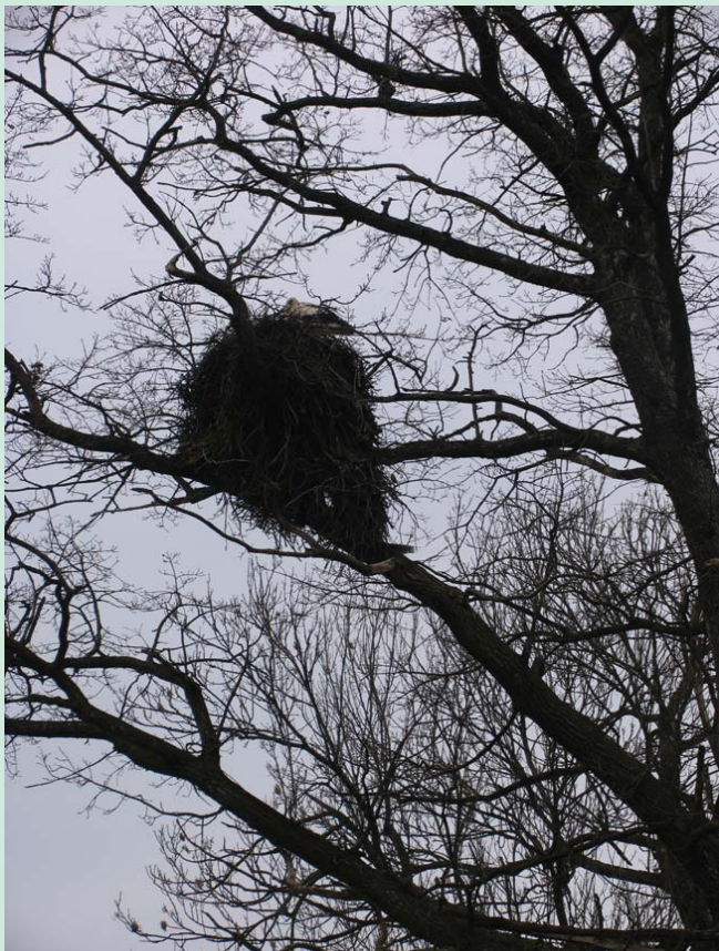
Lembo kaimo gandrai.