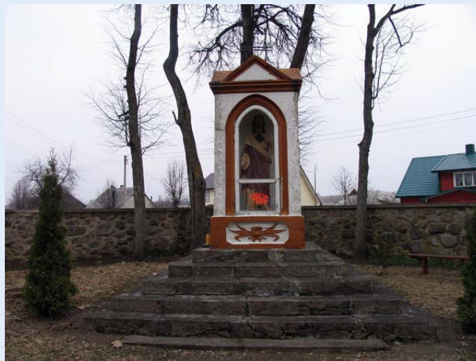
Koplytėlė Kvėdarnos Švč. Mergelės Marijos Nekalto Prasidėjimo bažnyčios šventoriuje

Lipynės per tvoras būna įrengtos tose vietose, kur per sodybas bei laukuose vaikštoma.