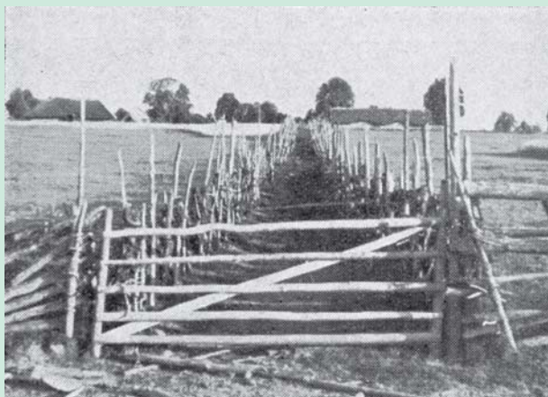
Lembo kaimo išgena.