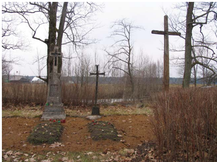
Lembo kaimo (Šilutės r.) kapinaitės 2006 m. pavasarį