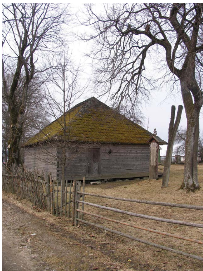
Kalbininko ir kunigo Kazimiero Jauniaus sodybos fragmentas Lembo kaime (Šilutės r.) 2006 m. pavasaris.