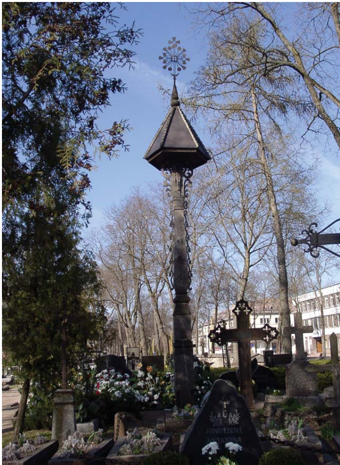
Kretingos miesto koplytstulpis.