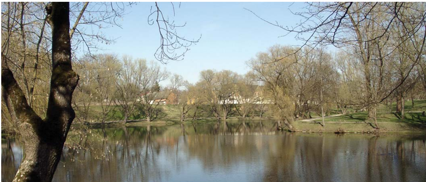
Kretingos parko tvenkinys.

Tarp Kretingos ir Telšių Rietavo ir Salantų. Tarp Platelių ir Kulių. Tai Plungės miestas puikus. Nedidelis, bet gražus. Prekybininkais gausus. Nuo šiaurės ir vakarų Apiečia miestą ratu Tekėdamas iš rytų Čia Babrungas paslaugus. Jo vandenėlis skaistus Malūnams suka ratus. Išmargintas tvenkininių Ir įvairių sodinių. Taip mėgstamas mokinių. Tai Plungės parkas gražus. Kurs dieną linksmas, jaukus.