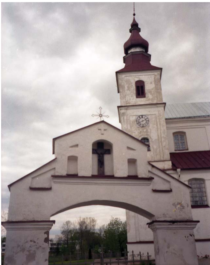
Telšių katedros ir vartų fragmentas.

Neišpasakytai skaudžios Neilgai jis karaliavo Ir globojo žmones savo. Žilvinėlio kraujo puta, Eglės ašaromis apverкта, Reiškė, jog neteko doro Jūros Palangos valdovo. Neringos ir Naglio sūnus Jaunas būti dar valdovu,