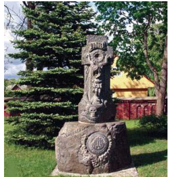
Iš kairės: Salantų bažnyčios pastato fragmentas, „Nukryžiuotasis“ Plungės bažnyčioje ir Lietuvos krikšto jubiliejui skirtas kryžius Plungės bažnyčios šventoriuje.