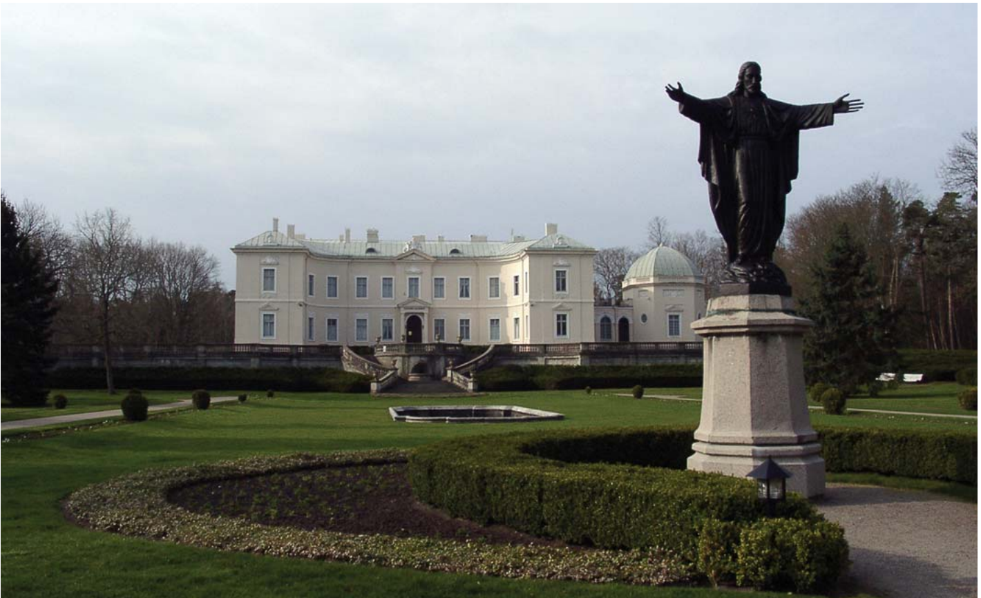
Palangos botanikos parkas, grafų Tiškevičių rūmai (Palangos gintaro muziejus), „Laiminančio Kristaus“ skulptūra.