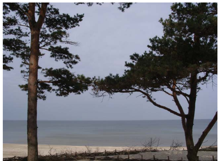
Iš kairės: Palangos Lurdas ir pajūrio pušys.