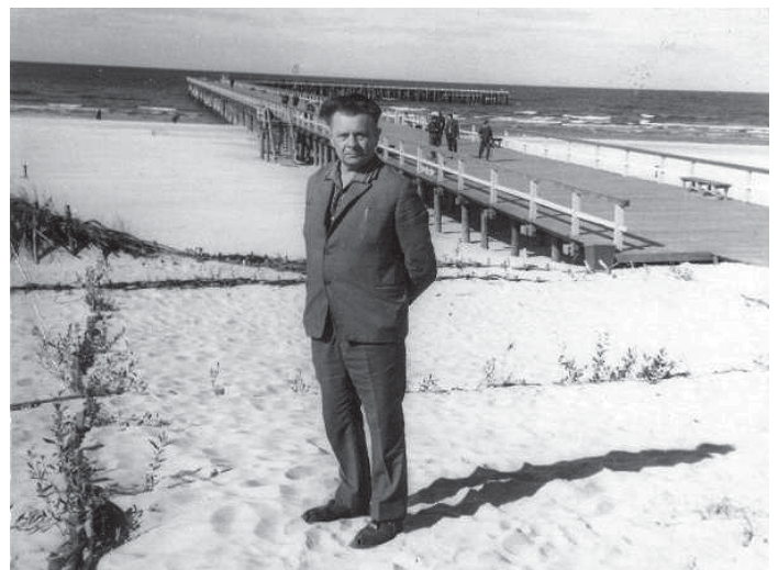
Adolfas Jucys Palangoje 1969 m.