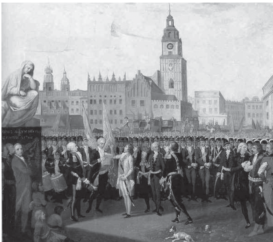
Pranciūkus (Franciūėkas) Smugleviėius (lenk. Franciszek Smuglewicz, 1745–1807). „Tado Kosciūėkos priesaika Krokuvos turgaus aikėtėje“. 1797 m. Nacionalinis muziejus Poznanėje (Lenkija).