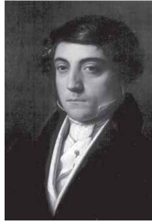
Iš kairės: Wolfgang Amadėjus Mocartas (1756–1791). 1819. Dailininkė Barbara Krafft; Džoakinas Antonijus Rosinis (1792–1868). Dailininkas Vincentas Camuccini (1771–1844)