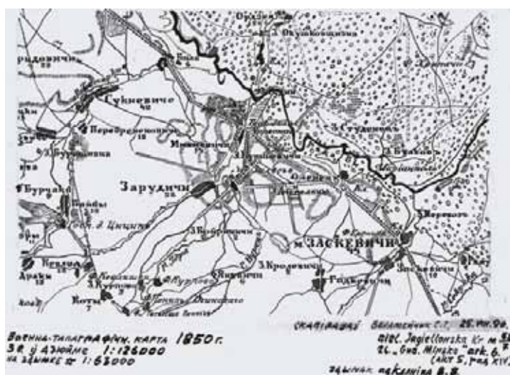
Zalesė topografiniame žemėlapyje. 1850 m.

galime sudaryti sąlyginę trijų polonezų „populiarumo chronologiją“: 1792 m. pradžia Rusijoje – fa-minor; 1794 m. Europoje – fa-mažor; nuo 1817 m. visame pasaulyje – Nr. 13 A minor (apie kitą šio polonezo pavadinimą bus pasakojama vėliau).