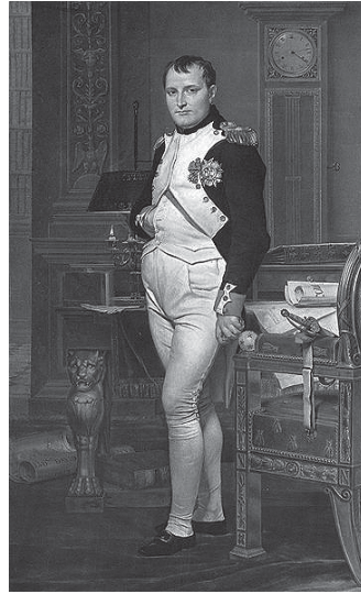
Iš kairės: Rusijos imperatorius (1801–1825), Suomijos didysis kunigaikštis (1809–1825), Lenkijos karalius (1815–1825) Aleksandras I (1777–1825). Dailininkas Vladimiras Borovikovskis; Prancūzijos imperatorius (1804–1814), Italijos karalius (nuo 1805 m.), Reino sąjungos protektorius (nuo 1806 m.) Napoleonas Bonapartas (1769–1821). Dailininkas Žakas Luji Davidas (1748–1825)

aut. past.], ir ji atrodė rimta, gerbiama, žinoma ir patraukli poniam, prieš kurią, kaip prieš deivę, buvo lenkiamos galvos tiek pas mus, tiek užsienyje.“