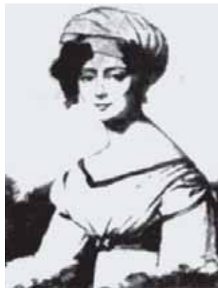
Iš kairės: kompozitorius Nikola Paganinis (1782–1840). Dailininkas nežinomas; Marija Šimanovska. N. Žako miniatiūra. XIX a.

ją, ir ją – atsitiktinai, susitikau Mocartą, likus kokiems trimis metams iki jo mirties. Daugiau nei valandą aš buvau toje pačioje draugijoje kaip ir jis... Negalėjau patikėti, kad esu šalia tokio žymaus žmogaus, su kuriuo seniai svajojau susipažinti. Jis išėjo iš salono, o aš taip ir likau, netekęs malonumo bent minutę pasikalbėti.“