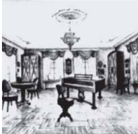
Mykolas Kleopas Oginskio kabinetas. Architektės L. Ivanovos rekonstrukcija

aut. past.), [...] biliardas iš alksnio ant šešių kojų, aptemptas žalia drobe. Šešios raudonmedžio kėdės. Raudonmedžio spintos, didelė beržinė spinta, keturios uosio spintos.“