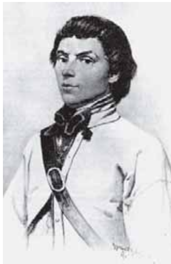
Tadas Kosciuszka 1794 m. su sukilėlio uniforma. Portreto autorius nežinomas

nežinotų, M. K. Oginskis paliko beveik visą dalinį Dusetose (Breslaujos žemės), o pats su trimis šimtais kavaleristų patraukė link Dauguvos – prie Dinaburgo. Tačiau čia sukilėlių jau laukė – rinkosi rusų kariuomenė. Po kurio laiko, taip ir nepersikėlęs per upę, dalinys grįžo į Dusetas. Tiesa, 30 savanorių vis dėlto įsibrovė į miestą ir netyčia jį padegė.