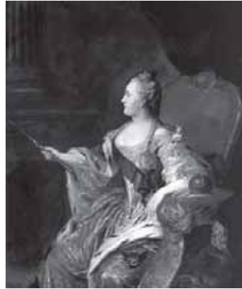
Iš kairės: Rusijos imperatorių Jekaterinos II ir Petro III sūnaus, Rusijos imperatoriaus (1796–1801) Pavelo I Petrovičiaus (1754–1801) portretas. Dailininkas Steponas Ščukinas; Rusijos imperatorienės (1762–1796) Jekaterinos II (1729–1796) portretas. Dailininkas F. S. Rokotovas

ratais, T. Kosciuška atsistatydino. 1792 m. birželio 26 d. Prancūzijos konventas jam, taip pat Dž. Vašingtonui, I. Pestalociui, F. Šileriui ir kai kuriems kitiems asmenims suteikė Prancūzijos garbės piliečių vardus. 1792 m. pabaigoje T. Kosciuška politiniais sumetimais išvyko į Leipcigą.