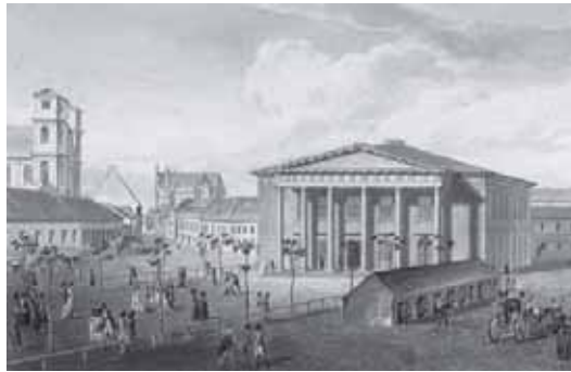
„Vilniaus rotušė“. 1797 m. Dailininkas Juozapas Peška (1767–1831) Vilniaus universiteto bibliotekos Grafikos kabinetas

ir pristatytas Jekaterinai II, kuri jį priėmė „pagarbiai ir mandagiai“. Savo atsiminimuose M. K. Oginskis paminėjo vieną tokio priėmimo priežastį – jo polonezas fa-minor, sukurtas Varšuvoje 1792 m. pradžioje, buvo labai populiarus Rusijos sostinėje, pagal jį buvo šokama visuose pokyliuose.