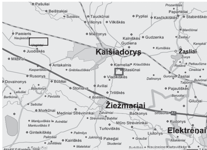
Uogintai (viršuje, kairėje) Kaišiadorių rajono žemėlapyje.