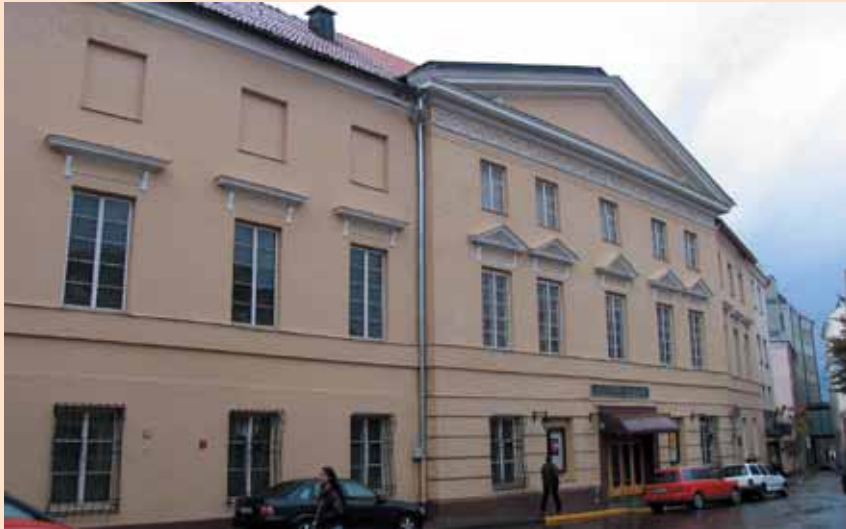
Oginškių rūmai Vilniuje (pastato fasadas iš Arklių gatvės pusės)