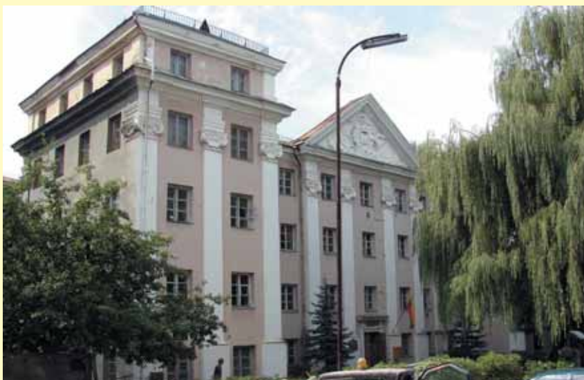
Sluški rūmai. 2007 m.