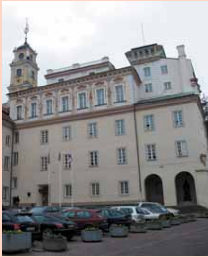
Iš kairės: Vilniaus universiteto observatorijos kiemelis ir Vilniaus universiteto centrinis pastatas (įėjimas į Universiteto rektoratą, biblioteką)