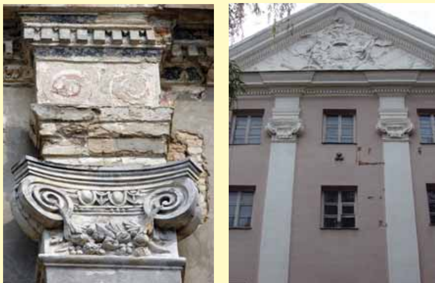
Sluškų rūmų pastato fragmentai. 2007 m.

lais, tvenkiniais, fontanais ir egzotiška augalija. Dabartiniu metu istorinio želdyno vietoje išlikęs tik bendro naudojimo želdynas – Sluškų skveras.