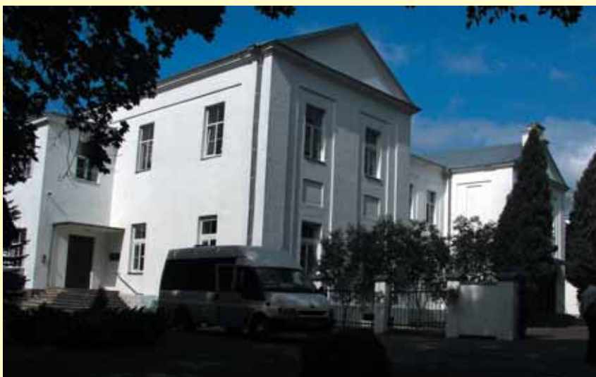
Buvusio Mūro Strėvininkų dvaro rūmai. 2007 m.