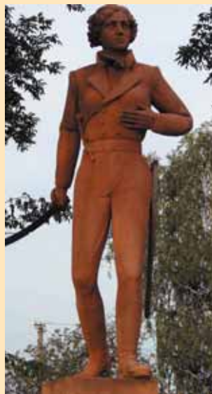
Emilijos Pliaterytės paminklas ir memorialinė lenta Kapčiamiestyje. 2007 m.

čia ir ją išpuošė (dabartinė medinė Dievo Apvaizdos bažnyčia pastatyta 1956 m.).