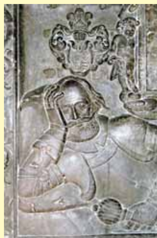
Teodoro Bogdano Marcijono Oginskio (1568–1640) ir Samuelio Levo Oginskio (1625–1695) antkapinės plokštės Kruonio bažnyčioje; Samuelio Levo Oginskio antkapinės plokštės fragmentas. 2007 m.

nes lubas turėjęs dvaro centrinis pastatas buvo 36 m ilgio. Čia buvo keletas erdvių salių, nemažai kitų prabangiai įrengtų patalpų. Po keliomis iš jų yra buvę rūšiai, perdengti cilindriniais skliautais.