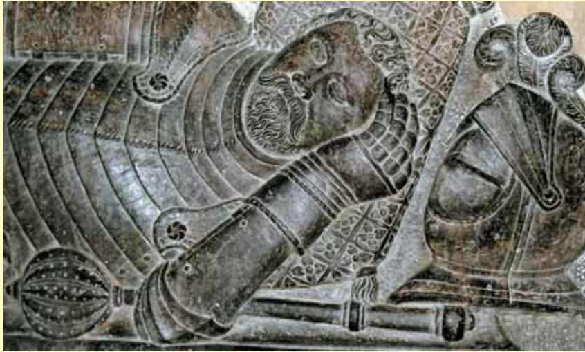
Teodoro Bogdano Marcijono Oginskio antkapinės plokštės (XVI–XVII a. sandūra) fragmentas. 2007 m.

Dabartinis miestelis prie Kruonio upelio susiformavo XIX a.