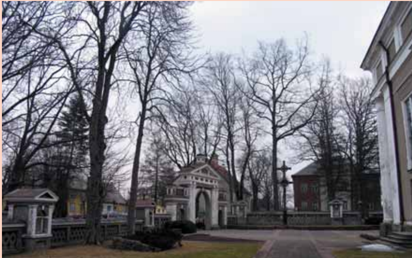
Kulių šv. vyskupo Stanislovo bažnyčios šventorius, vartai. 2006 m.