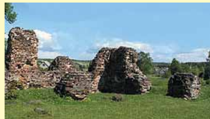
Kruonio Švč. Mergelės Marijos Angelų Karalienės bažnyčia ir Kruonio dvaro pastatų likučiai. 2007 m.