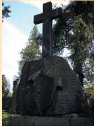
Antkapiniai paminklai Vilniaus šv. Petro ir Povilo (Saulės) kapinių kunigaikščių Oginskių memoriale

ir kt. įtakingų šeimų narius. Už savo lėšas artimieji įrengdavo tvirtus ir ilgaamžius laidojimo rūsius, tašyto akmens plokštėmis sutvirtindavo kalno šlaitus, įrengdavo atramines sienes ir laiptelius. Tačiau ploto trūko, tad laidota tankiai. Tik 1945 m. prie kapinių buvo prijungti 2 ha 3 .