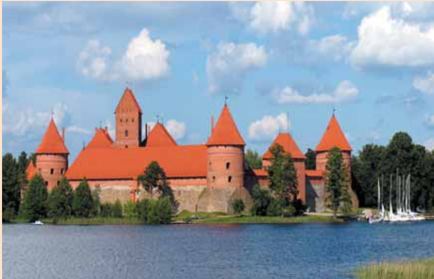
Gotikinė Trakų pilis, XIV a. II p. – XV a. pirmajame dešimtmetyje pastatyta Kęstučio ir Vytauto iniciatyva. Pilis atstatyta, restauruota 1951–1962 m. pagal B. Krūminio ir grupės kitų architektų projektus