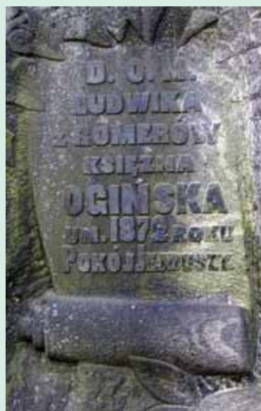
Kunigaikščių Oginskių memorialo antkapinių paminklų fragmentai Vilniaus šv. Petro ir Povilo (Saulės) kapinėse

abejotina, kad juos kūrė, gamino tie patys Vilniuje dirbę meistrai 4 .