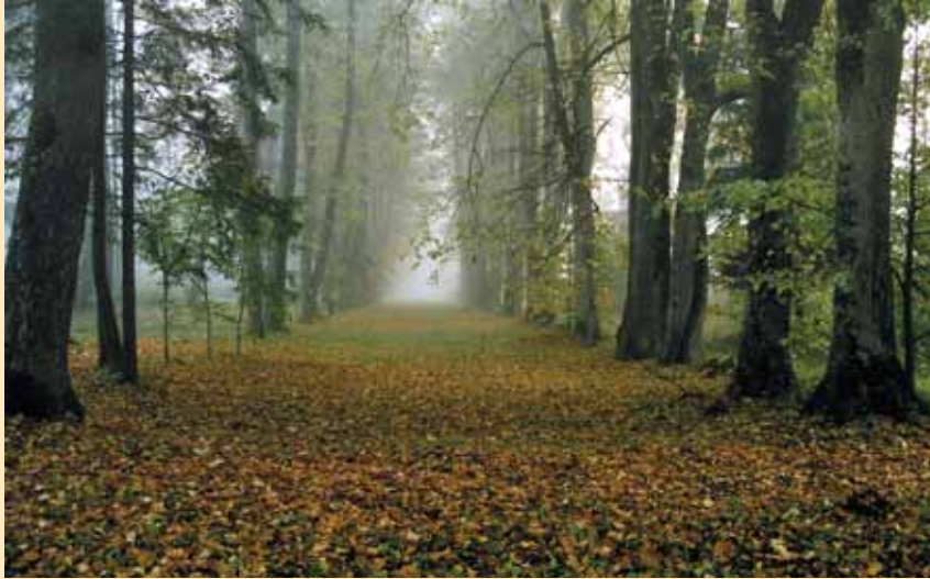
Rietavo parko „Kunigaikščių“ alėja rudenį

Tą pačią vasarą devyniolikos bendraminčių, Oginskių kultūros paveldo puoselėtojų būrys iš Rietavo, Plungės, Platelių, Vilniaus išsirengė į Zalesę.