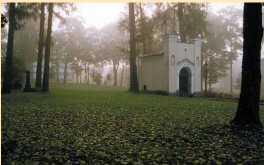
Kunigaikščių Oginskių „Aušros Vartų“ koplyčia Rietavo dvaro parke

rinius, nei apie pačią M. K. Oginskio asmenybę, o yra įsidėmėję tik šio polonezo muziką ir tuos du, šiek tiek nekasdieniškus, sinoniminius jau tapusius žodžius – Oginskio polonezas . Tai – raktas į prakilniu ilgesiu vilnijančią melodiją, į tuos raiškiai moduluotus muzikinius akordus... Jau du šimtmečius per bekraštes garsų ir įvykių erdves prakilniu ilgesiu vilnijanti šio polonezo melodija, jo raiškiai moduluoti, atsikartojantys akordai keliauja ir smelkiasi į žmonių širdis, įsiūbudami čia sunkiai išvelgiamas jausmų ir vaizduotės gelmes. Tūkstančiams klausytojų ši melodija – tai vienintelė gija, vedanti į dramatiškus 1794-uosius metus, kai ne tik M. K. Oginskis, bet ir daugelis kitų tuometinių patriotų pirmą kartą patyrė Tėvynės praradimo gėlą .