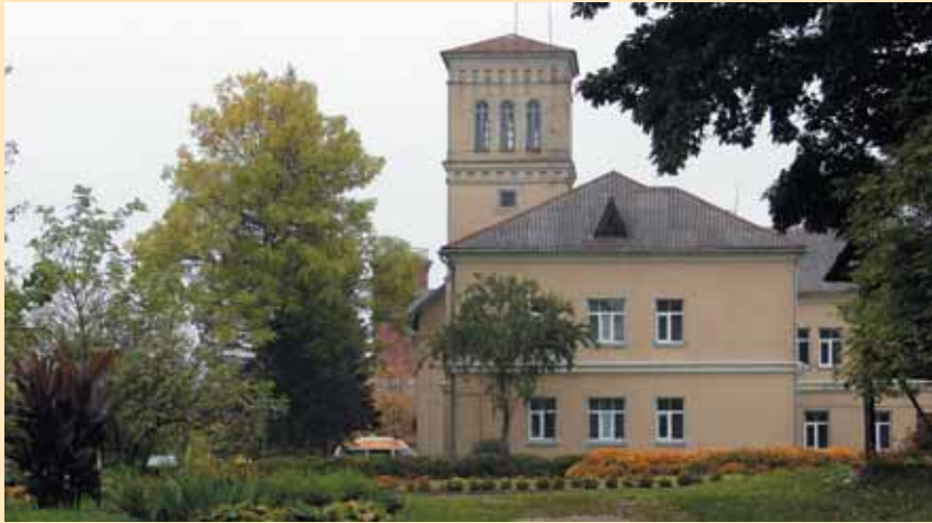
Buvusi Rietavo dvaro oficina su laikrodžio bokštu ir tarpukariu iškilusiu priestatu (priekyje). Šiuose pastatuose dabar veikia Rietavo pirminės sveikatos priežiūros centras ir keletas kitų Rietavo savivaldybės įstaigų

nuolynai. Neužmirštas XIX a. Rietave netikėtai prasidėjęs kultūros, švietimo, technikos, socialinių naujovių proveržis. Visa tai – prielaida tarptautinėms mokslinėms ekspedicijoms organizuoti.