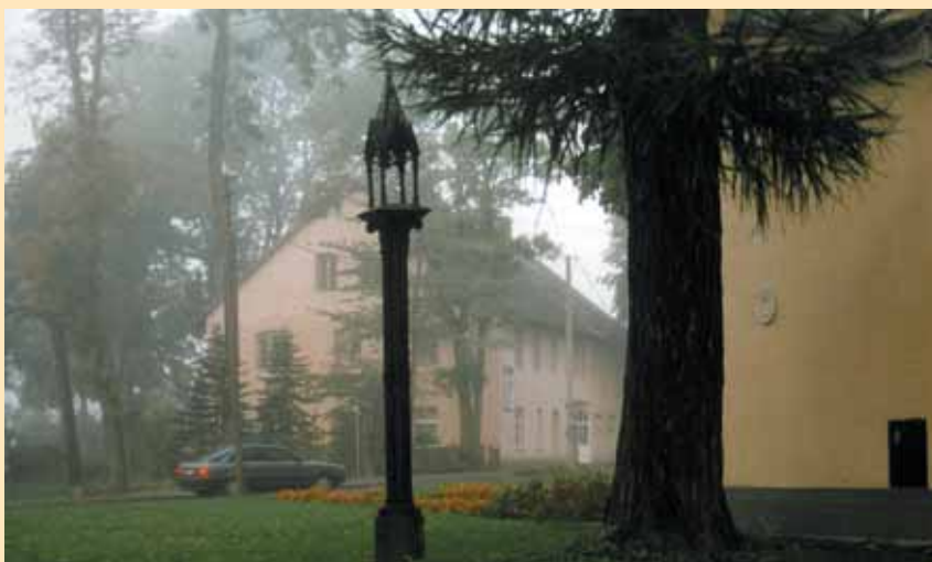
Rietavo Oginskių dvaro parke (koplytėlė ir buvęs Rietavo dvaro pastatas, kuriame dabar veikia Rietvo „Aušros“ katalikiška vidurinė mokykla)