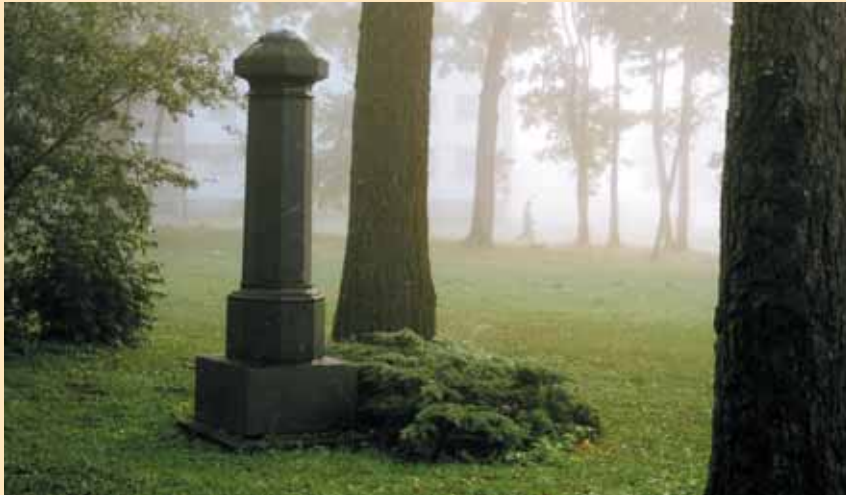
Obeliskas kunigaikščio Irenėjaus Kleopo Oginskio (1808–1863) amžino poilsio vietoje – Rietavo dvaro parke, šalia „Aušros Vartų“ koplyčios

dėlės per nugarą pradeda bėgioti); Česlovui Sasnauskui – tyra ir graudi „Karvelėli, mėlynasai“ melodija; Česlovui Milošui – esė rinkinys „Tėvynės ieškojimas“; Antanui Miškiniui – garsiosios tremtinio psalmės; talentingai dzūkaitei – vienai iš šimtųjų šiuolaikinių emigrantų bangos – šis išgyvenimas prasiveržė paprastais laiško žodžiais buvusiai savo mokytojai į Merkinę: „[...] gyvenu Londone, dirbu, studijos artėja prie pabaigos... Lyg ir nieko netrūksta. Žada iš Lietuvos aplankyti brolis su tėveliais, bet juk Tėvynės tai neatveš... “