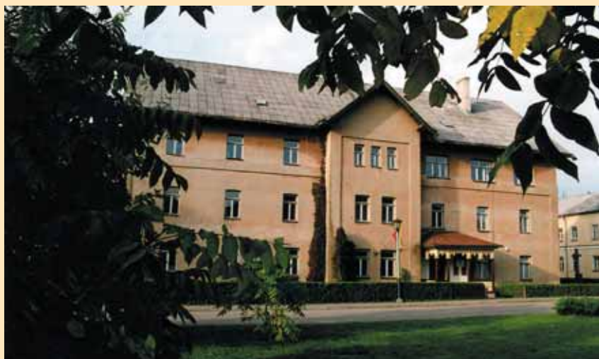
Buvę Bogdano Oginskio Rietavo dvaro orkestro muzikantų namai (bendrabitis), kuriuose dabar veikia Rietavo „Aušros“ katalikiška vidurinė mokykla

tų aidas, nesenstantys polonezo „Atsisveikinimas su Tėvyne“ akordai.