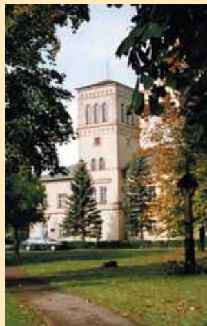
Kunigaikščio Bogdano Oginskio (1848–1909) memorialinė lenta prie Rietavo parke stovinčios Oginskių koplyčios sienos; buvusios Rietavo dvaro ofsinos su laikrodžio bokštu, kurioje dabar veikia Rietavo pirminės sveikatos priežiūros centras, fragmentas

toliese stovėjusios sodybos šeimininke. Deja, ji nieko negalėjo pasakyti apie prieškario metais čia gyvenusius žmones, o ką jau bekalbėti apie Oginskių laikus.