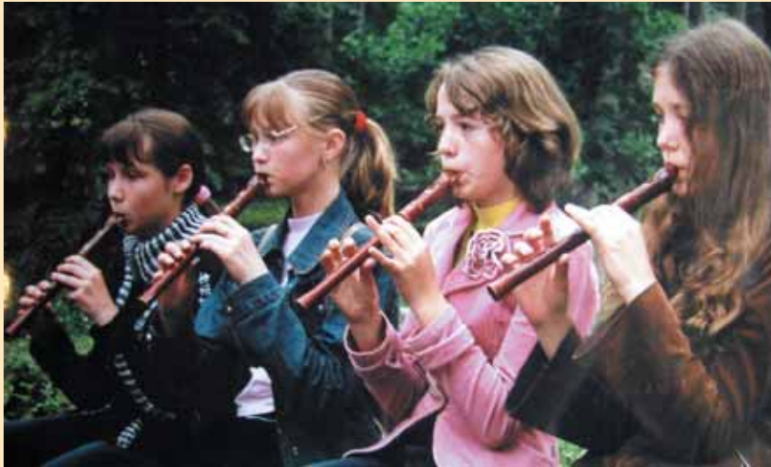
2006 m. Rietave vykusioje tarptautinėje jaunimo stovykloje „Tiltas į trečiąjį krantą“ groja Zalesės Mykolo Kleopo Oginskio muziejaus mergaičių ansamblis „Altanka“

gramą. Kartu su šešių Baltarusijos mokslininkų pranešimais konferencijoje buvo perskaityti ir penki Oginskių kultūros paveldo tyrinėtojų, puoselėtojų iš Lietuvos pranešimai.