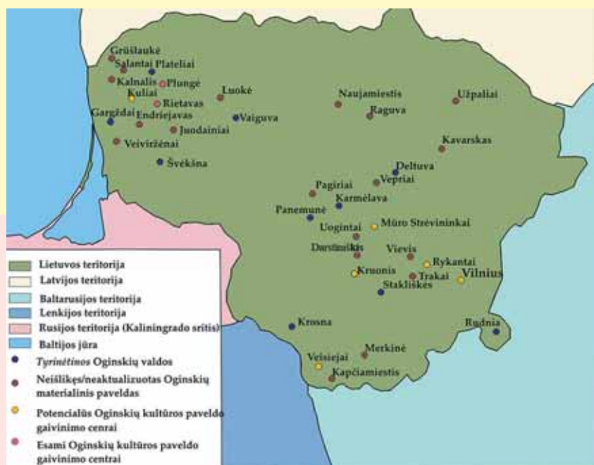
Žinomi kunigaikščių Oginskių kultūrinės veiklos centrai Lietuvoje. Sudarė Giedrė Rutkauskaitė