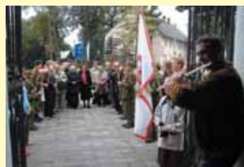
II-ojo tarptautinio Mykolo Oginskio festivalio ir 2007 m. Kultūros paveldo dienų dalyviai Rietave, prie Oginskių koplyčios

Nėra žinomos tikslios datos, kada Oginskiai šias vietas valdė. Kebloka nustatyti net jų lokalizaciją 5 . Į daugelį šiandien mums išskylančių klausimų, susijusių su šiomis Oginskių valdytomis vietovėmis, atsakymus galėtume gauti tik atlikę archyvų tyrimus, archeologinius kasinėjimus.