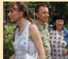
Iš kairės: 2007 m. ekspedicijos dalyviai Veisiejų dvorvietėje ir Šv. Petro ir Povilo (Saulės) kapinėse Vilniuje; Rietavo šv. arkangelo Mykolo bažnyčios „Angelo“ skulptūros fragmentas

dijos apie Oginskių muzikinių tradicijų gaivinimą Rietave, Plungėje, taip pat ir visoje Lietuvoje. Šie ryšiai padėjo nutiesti kelią ir į pirmuosius tarptautinius Mykolo Oginskio festivalius, kurių idėja galutinai buvo subrandinta pradėjus įgyvendinti pasirengimo Mykolo Kleopo Oginskio 250-osioms metinėms programą.