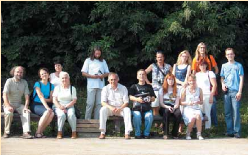
2007 m. ekspedicijos dalyviai Trakuose

operos „Nabukas“ emocinę „Vergų choro“ įtaigą ir šios muzikos uždegančią reikšmę tuometinių Italijos patriotinių jėgų vienijimuisi. Anot profesoriaus, ne mažesnė įtaiga slypi ir M. K. Oginskio poloneze „Atsisveikinimas su Tėvyne“.